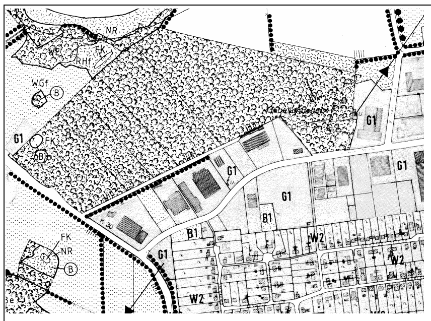
Abbildung 1: Ausschnitt aus dem Landschaftsplan Bestand mit Darstellung der naturschutzfachlichen Waldabgrenzung

Auf den Flurstücken 12/22 und 74/1 ist mittlerweile Wald entstanden (vgl. Abbildung 1). Das Grundstück war vormals parkartig angelegt und ist bis kurz nach dem 2. Weltkrieg als Genesungsheim genutzt worden. Auf dem Grundstück liegt im strabennahen Bereich ein Streifen Nadelforst, dahinter finden sich im Wald Reste der damaligen Parkgehölze in Form älterer Rotbuchen, Winterlinden, Kastanien und Stieleichen mit zum Teil mächtigen Stammdurchmessern.